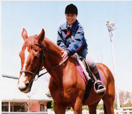
▲写真撮影に協力してくれた「あひお」くん(アキラ)は、同クラブ代表の騎手男子(17歳)は20歳のおじいさん!?「体験乗馬で活躍中です!」(あさひ)

〒362-8703 埼玉県上尾市上尾村750番地 TEL.048-773-3111 FAX.048-776-9090 http://www.asecci.or.jp E-mail:inf@asecci.or.jp