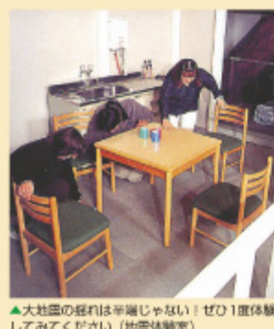
▲大地震の揺れは半端じゃない！ぜひ1度体験してみてください（地震体験室）

いざというとき、どれだけ行動できるか、大地震のシミュレーションができる「地震体験室」や、真っ白い煙の中で身をかかめて進み脱出口をめざす「煙体験室」、台風の脅威を肌で感じる「暴風雨体験室」など、防災についての基礎知識や災害時の対処法が無料で体験学習できます。