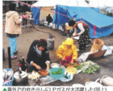
▲屋外での炊き出しにLPガスが大活躍した(同上)

地震などの災害発生時に、大量の電話が殺到すると、被災地内における電話がつながりにくくなります。比較的つながりやすい「災害用伝言ダイヤル(171)」や、ケータイ「災害用伝言板」や携帯電話メールを利用しましょう。被災地からの電話は、公衆電話のほうがつながりやすいので、避難時には小銭(10円玉)の用意を忘れずに! 災害時の安否確認方法を、家族や親族間で決めておくと、いざというときに役立ちます。