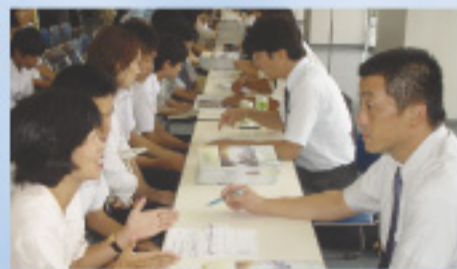
(公・私立高校入試担当との相談風景)