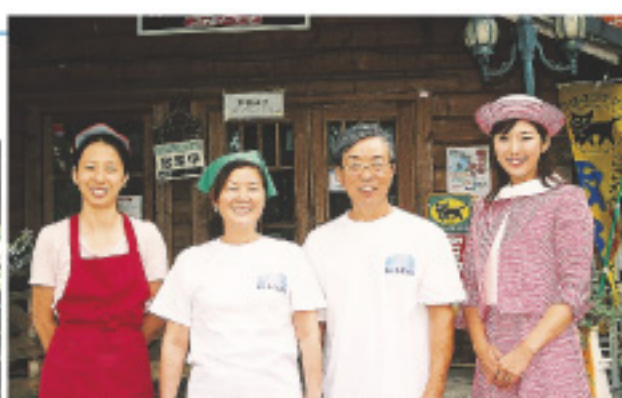
▲(左から) 歩さん、美津子さん、榎本代表。「動物たちに会いに来てね！」

だいて、このすばらしい風景と一緒に、作りたての“こだわりの味”を味わっていただきたいですね。