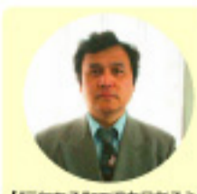
【元気ある工場を創ろう】とのキャッチフレーズのもとに、「小さくても此道の大きい会社づくり」の展開を進める経営を行い、独自の生産体制を確立している。現在、群馬県産業支援機構講師員、経済産業省下請け相談員も務める。