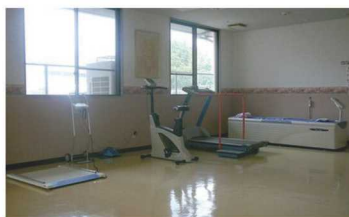
▲健康状態に合わせたトレーニング器具