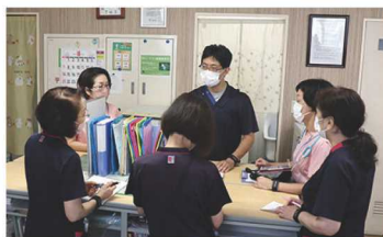
▲看護師・介護士が24時間常駐