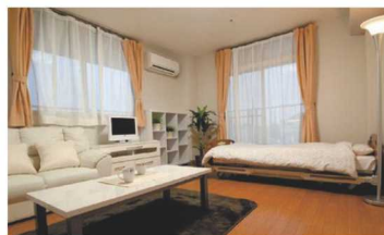
▲洋室タイプのモデルルーム