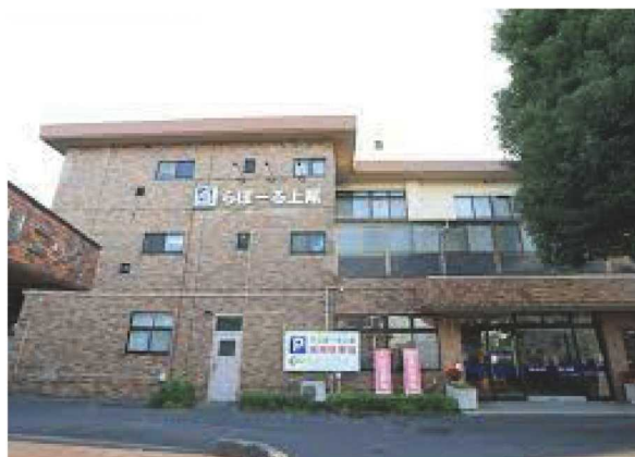
◀タイトル調でモダンな「らぽーる上尾」 周辺は緑が多く落ち着いた住環境です 外観

内閣府の「令和5年度版高齢者白書」によると、日本の65歳以上の人口は、3,624万人となり、総人口に占める割合(高齢化率)は29%で世界最高でした。さらには、2025年には、65歳以上の5人に1人が認知症患者になると見込まれており、多くの人が認知症になるリスクを抱えていると言えます。核家族や超高齢化が進む日本において、今後ますます需要が高まる高齢者住宅。老後の過ごし方や住まいの選択肢が広がり、自分や親が快適かつ安心感のある暮らしができる住まい探しには、早めの情報収集が必要です。