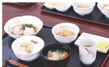
▲選択できるの2種類の献立やイベント食も